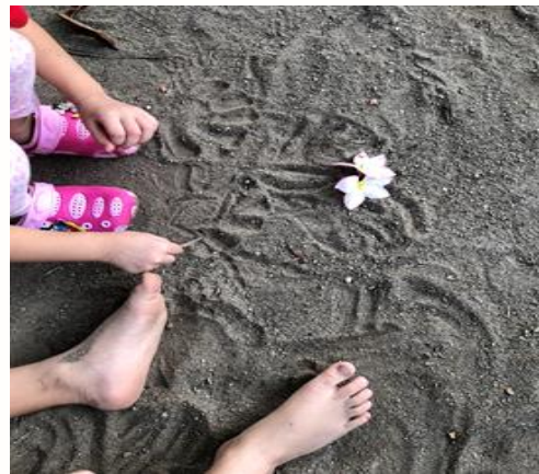
(撿拾雞蛋花、以樹枝當畫筆、沙地為幼兒揮灑的畫布)