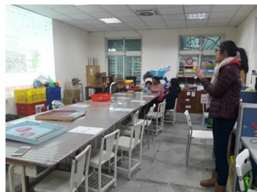
▲參觀新北市玩具銀行