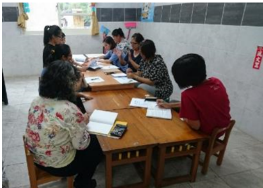
▲與計畫主持人分享園內現況

邀請部落耆老共同對老師們的教學經驗及部落文化教材教案做討論及分享。並對中心課程觀察(包含一日作息)、分享及討論，提出調整教室情境規劃建議。