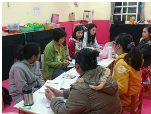
▲部落文化教材教案討論

為準備12月份幼照論壇上發表的文化課程，此次輔導延續9月份的部落文化教材教案(香菇、竹子)課程討論。最後對11月份親子講座做闖關設計討論及籌畫。