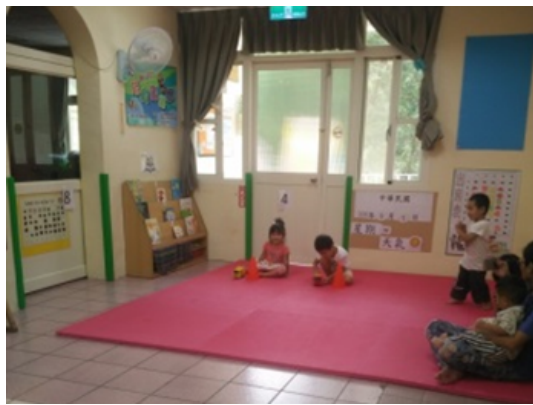
▲調整前：櫃子靠牆擺，空間大