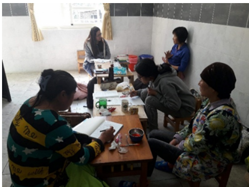
▲本學期作息表與教室空間調整後討論

分享五月主題課程「五月桃」：蔬果-套袋-採收-包裝，跟著部落農作物季節設計課程，從農忙到結束做拍照、錄音、紀錄等，並討論如何接續六月主題「水蜜桃」。安排老師分享使用在地素材的自製教具。