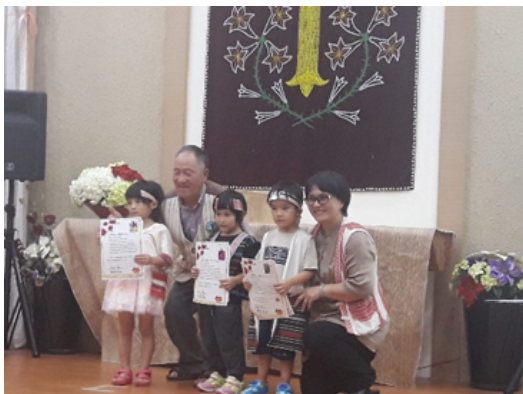
▲畢業典禮—頒發畢業證書

藉由畢業典禮分享過去一年教保中心學生成果(族語歌謠傳唱)，讓家長看見孩子的成長。並深入部落訪談這一年教保中心可以再調整的部分以及未來一年的課程能夠與在地文化如何的配搭。