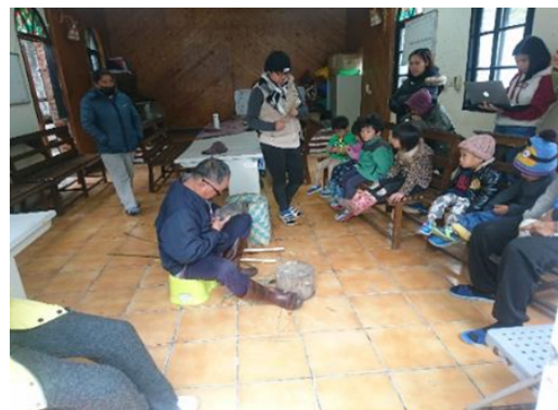
▲邀請部落耆老示範如何運用文化素材