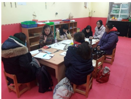
▲教保中心老師們與倪老師討論作息表

討論下學期課程主題及教室空間動線調整，並針對教保中心的作息表調整，建議安排更多自由活動的時間及動態的課程，如在一日作息中加入族語歌謠及律動課程。