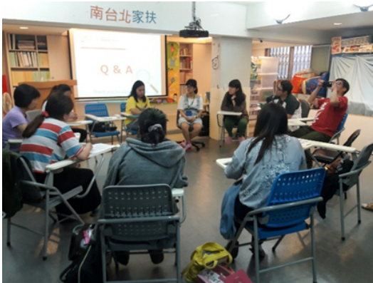
▲南台北家扶中心參訪_社工員分享

4/12-4/14 參觀法務部幼兒園、南台北家扶中心、種子美術館特展、育圃托嬰中心、中壢親子館，並在活動結束後進行分享交流。