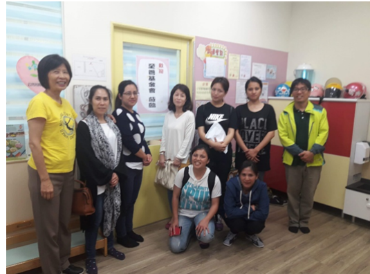
▲育圃托嬰中心參訪_大合照