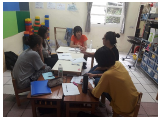
▲畢業典禮及部落訪談會後討論及心得