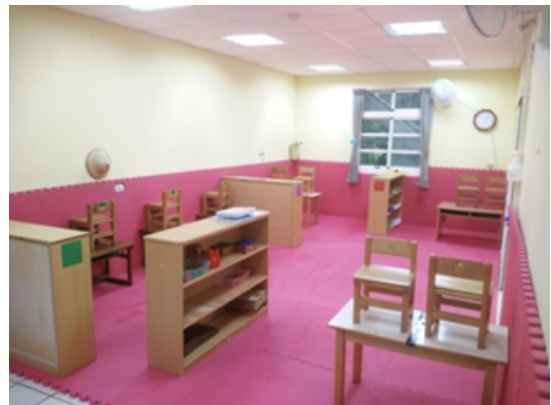
▲調整後：利用櫃子拉出分區空間