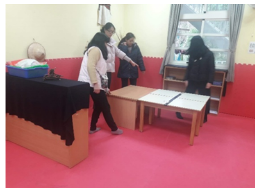
▲調整教保中心教室內動線