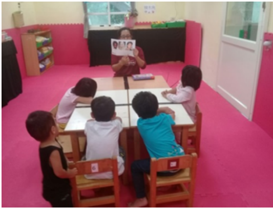
▲調整前：櫃子靠牆擺，桌子集中