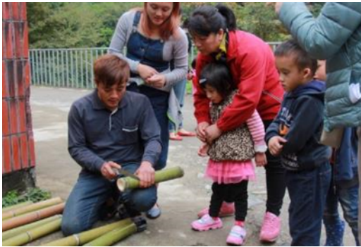
▲親子闖關：製作竹子存錢筒

透過親子活動串連家長與幼兒親密互動，促進家長與老師之間良好的互動關係，設計與部落文化素材相關的關卡，加深對在地文化的瞭解。在親子活動結束後老師們也進行檢討分享，並持續對文化課程教案做討論。