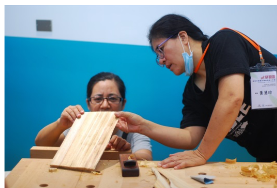
▲互相檢視是否平整