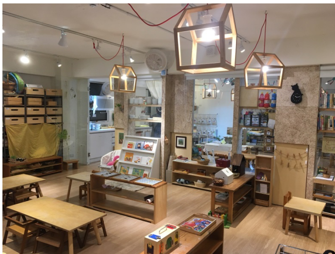
▲Ivy's house 托嬰中心教室一隅