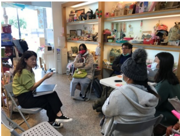
▲美燕老師簡介協會的服務