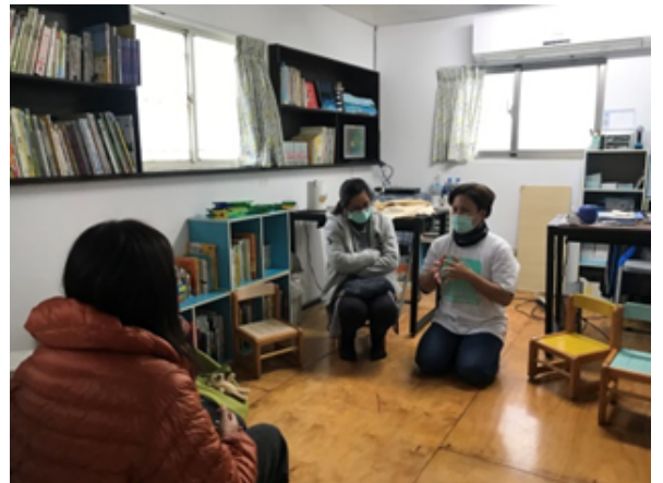
▼參訪成功游藝意遊(台東縣公私協力 托育資源中心成功站