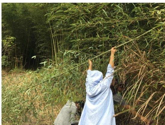
▲實際體驗孩子的日常：砍竹子