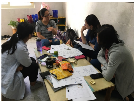
▼針對竹子課程歷程進行討論