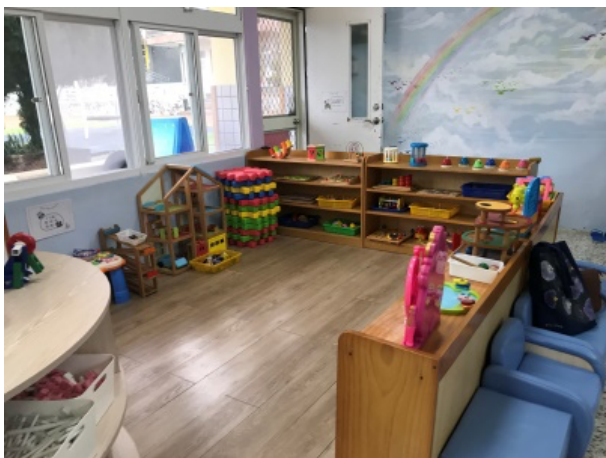
◀長濱站(慢飛天使)教室一隅