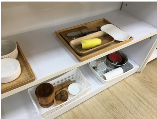
▲周老師親子教室—食物製備區▶